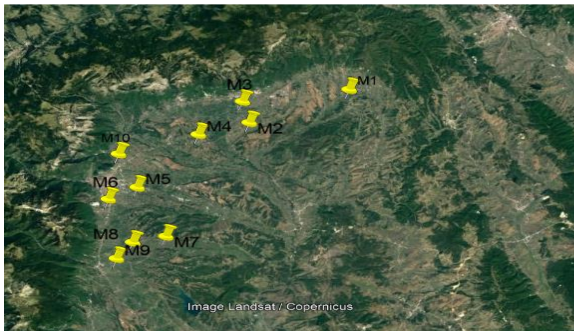
Слика 1. Локација на примероците прикажани на картата.

Првите 10 примероци беа земени и анализирани, примерок M1 - Општина Скендерај, мостри M2, M3, M4 - Општина Исток, примероци M5, M6, M7, M10 - Општина Пеќ и примероци M8, M9 во општина Деќан се претставено на слика 1.